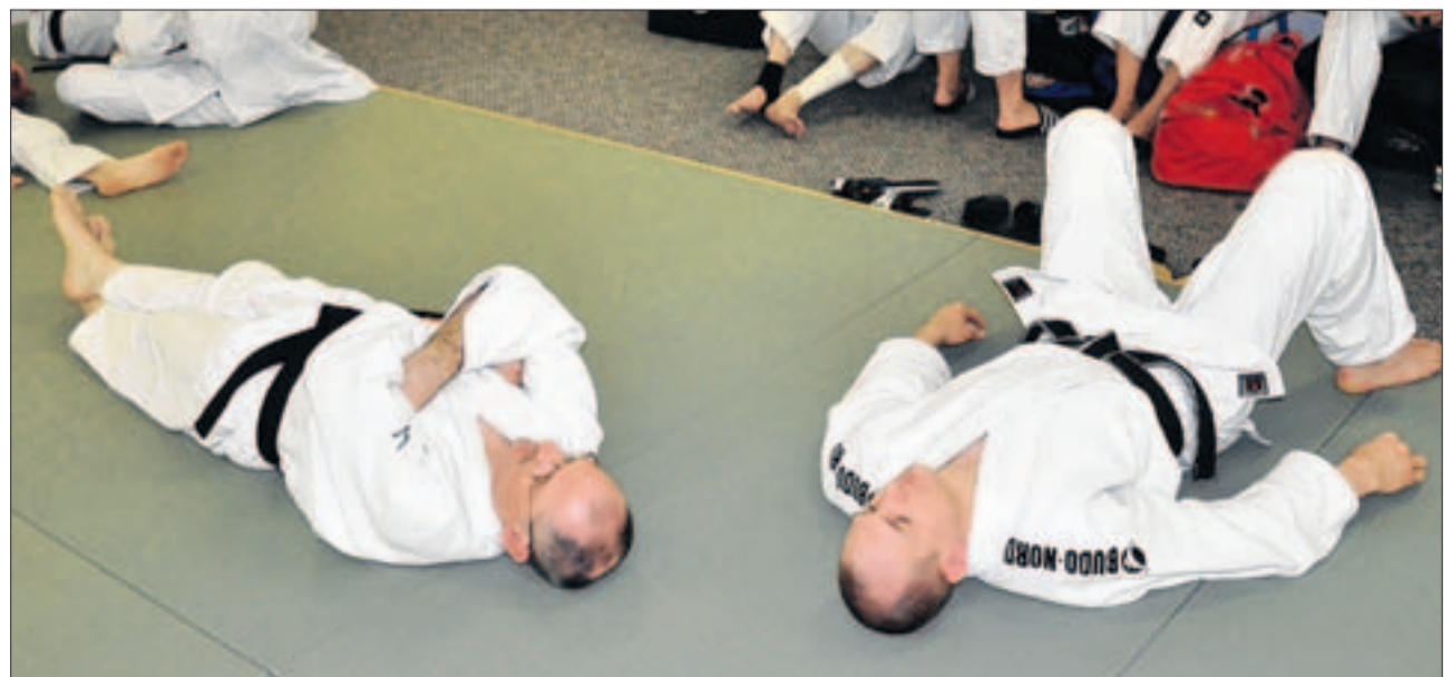
Meditationsübung? Nein, ein wohlverdientes Schläfchen in der Mittagspause.