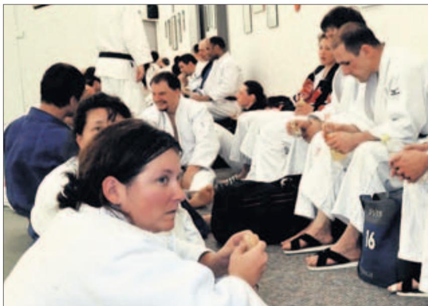
Mittags verschlingen auch Judokas ein Sandwich.